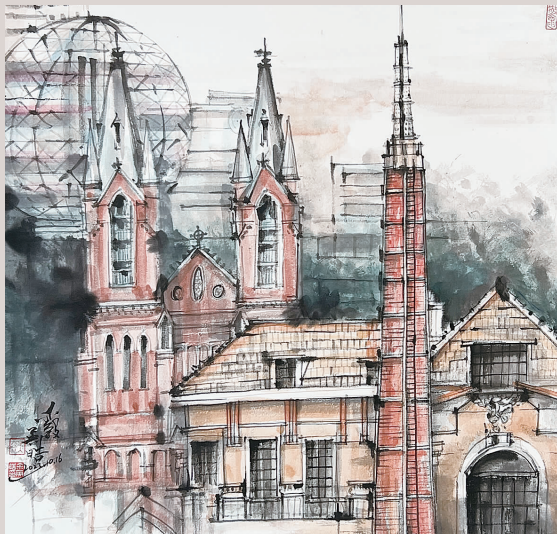
余英皓 国画《最美徐家汇》