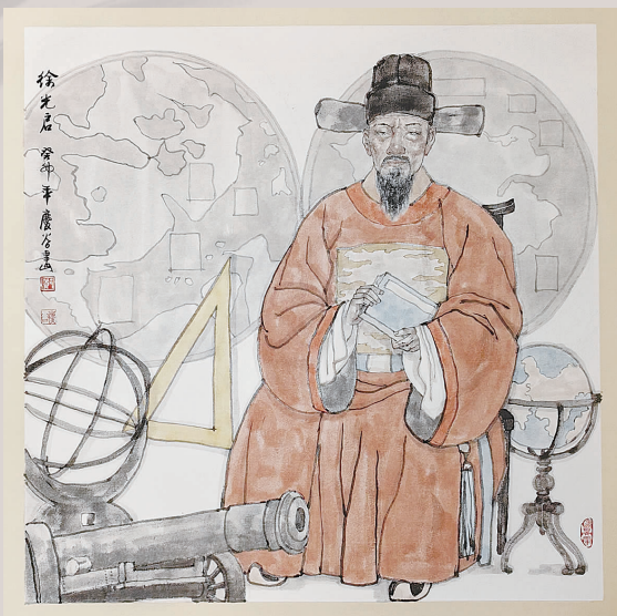
郑庆谷 国画《徐光启》