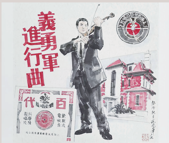
钱定华 国画《义勇军进行曲》