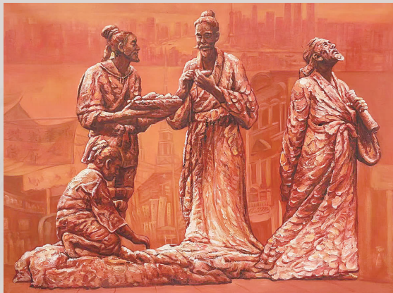
陈建华 油画《徐光启》