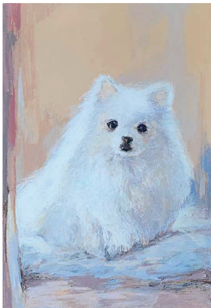
▲ 色粉《暖阳》 ◀ 色粉《隹·城 02》