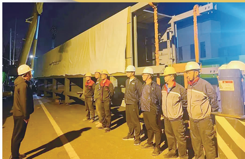
一段式整体装配电梯运送到现场

今年以来,康健街道电梯加装工作在各居民区有序开展。下一步,康健街道将持续推进电梯加装工作,做实加梯“暖心事”,指导施工方保质保量地做好文明施工,尽快实现居民的“电梯梦”。