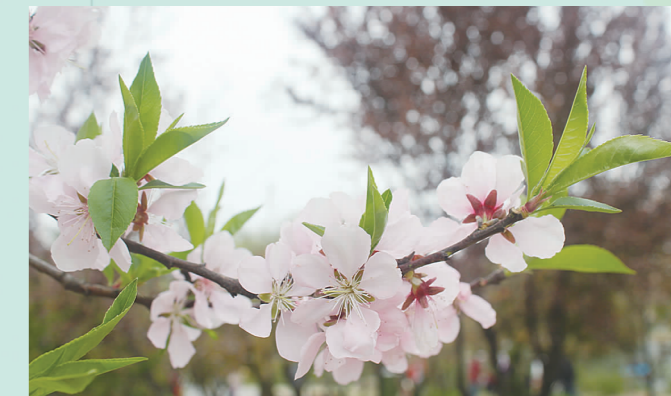
龙华西路上的桃花