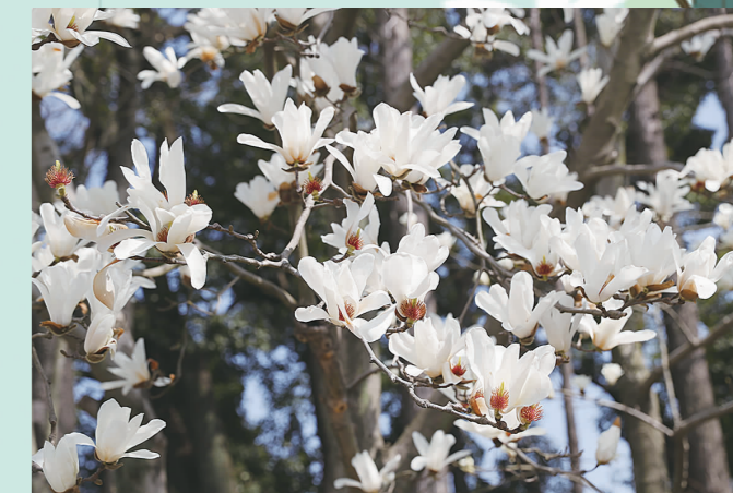
上植园内的白玉兰