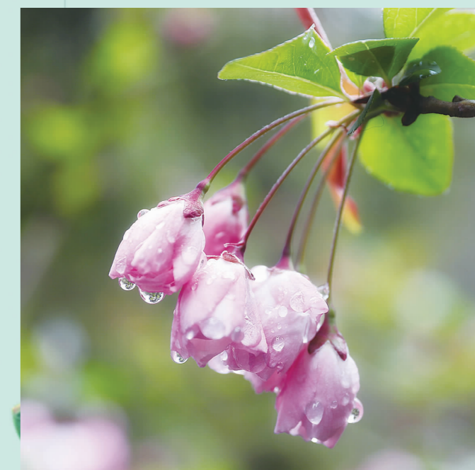
南丹路上的垂丝海棠