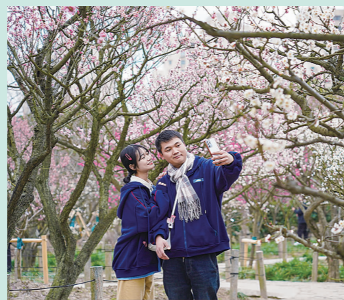
上海植物园的梅花