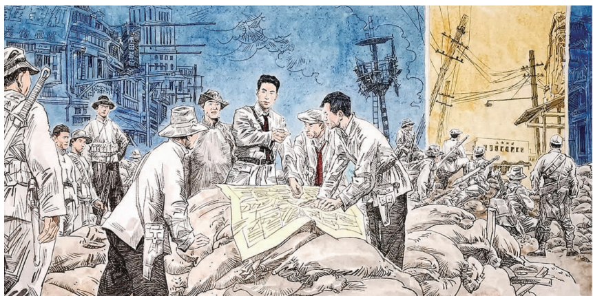
▲ 国画《上海工人第三次武装起义》