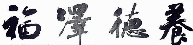
▲书法《养德泽福》 ▲书法《董其昌:画禅室随笔》