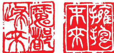
■ 魔都归来 拥抱未来(篆刻)