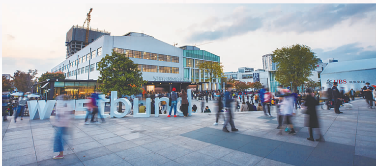
上海国际艺术品交易月

徐汇艺术人文气息浓厚,汇集众多影视产业主题和优秀影视人才。西岸传媒港作为以影视制作、数字娱乐为特色的上海艺术传媒文化新地标,设有中央广播电视总台CMG版权交易中心、国家多语种影视译制基地、超高清视听制播呈现国家重点实验室等,湘芒果等头部传媒企业纷纷入驻,将着力打造国际知名的文化传媒总部基地和上海文化产业新地标。