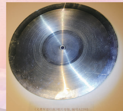
《义勇军进行曲》唱片母盘