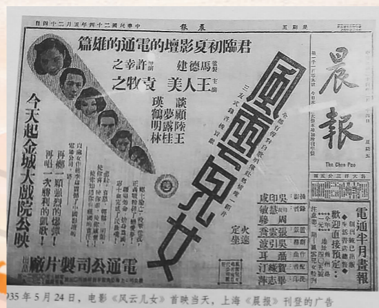
1935年5月24日，电影《风云儿女》首映当天，上海《晨报》刊登的广告