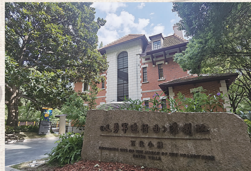
《义勇军进行曲》灌制地百代小楼