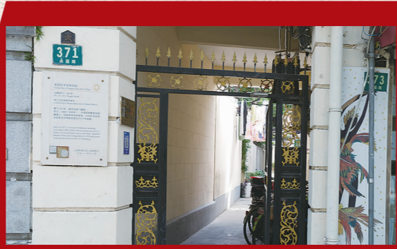
南国艺术学院旧址