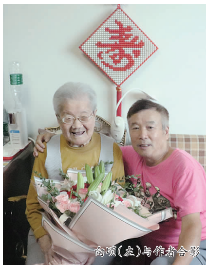
向顷(左)与作者合影

6月3日,公交龙华车队党员前来听老人讲革命故事。尽管向老已经是103岁高龄,但是她依然是神采奕奕地接待着每一位来访者。活动结束后,她又坚持要将公交的党员们送到家门口。