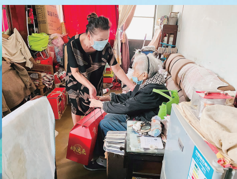
“金相邻”志愿者“左”与小区老人结对