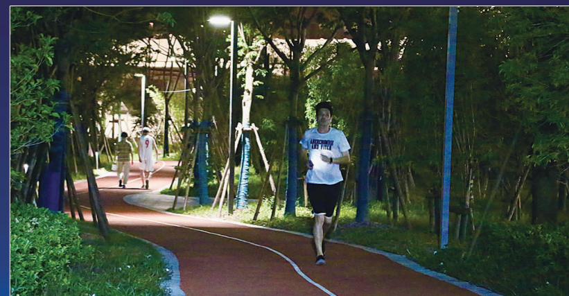
奔跑在徐家汇体育公园中