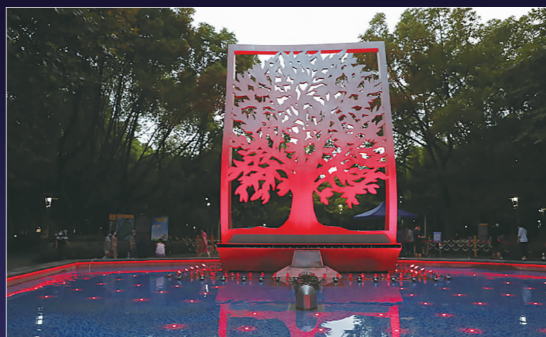
徐家汇公园的“雪树”