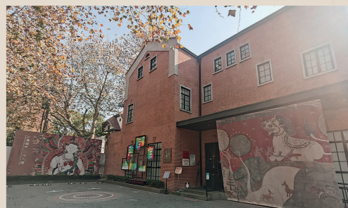
徐汇艺术馆外景照,建筑原为鸿英图书馆