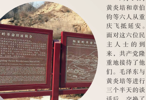
延安杨家岭革命旧址简介

1945年,黄炎培为巩固民主团结,促成国共谈判,联合王云五、傅斯年、章伯钧等人致电毛泽东,并提出了希望参观延安的要求,三周后延安复电邀请诸君访问延安。