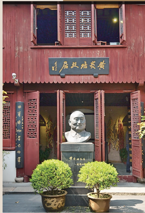
位于川沙的黄炎培故居