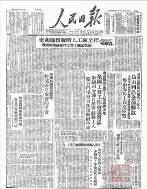
黄炎培在1949年8月24日《人民日报》发文:加强内部团结和警惕,警告美帝好梦做不成

在1949年8月5日,美国国务院发表了关于中美关系的“白皮书”——《美国同中国的关系》,直接干涉中国内政。美国虽自诩为民主国家,却公然鼓励中国那些所谓的“民主个人主义”再显身手,试图推翻新政权。曾经目睹了外国势力侵华种种恶行的黄炎培,按捺不住自己的激情心情撰写了批驳文章《加强内部团结和警惕,警告美帝好梦做不成》在8月24日《人民日报》和《展望》周刊上发表,直接指出“发展民主个人主义”是错误的,美国的好梦是做不成的,只有新民主主义,才是中国和中国人民唯一的光明幸福的道路。