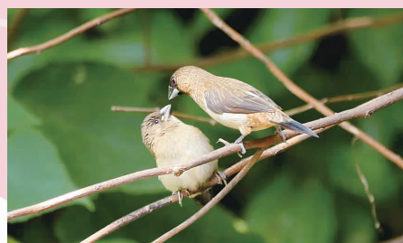
▲白腰文鸟

据了解,除了加强水环境污染源头监管治理,徐汇区还全面提升水环境智慧监管,完善水质监测的全天候、全河段、全覆盖网络,以无人机、无人船和人工巡河相结合的模式,建立应用“河道立体巡查监测系统”。