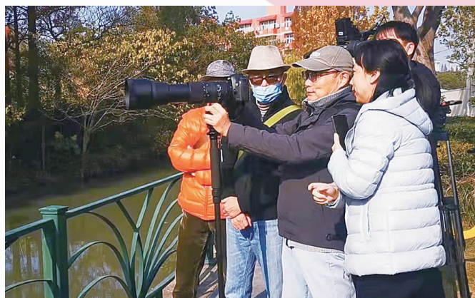
▲观鸟拍鸟乐在其中

“赶海”观鸟不必远行,市中心的徐汇也有这样的亲水风景,您是否也想来体验下这份自然野趣呢?