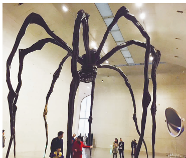
▲ 布尔乔亚作品《母亲》 ▲ 《为我们伟大祖国站岗》特展